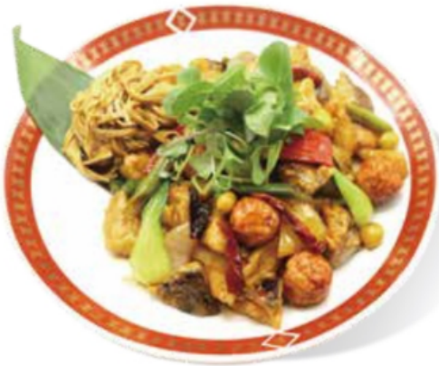
어항가지튀김 ★ NEW