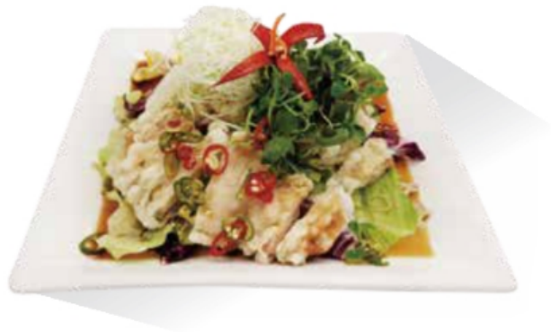
봄나물유린기 ★ NEW