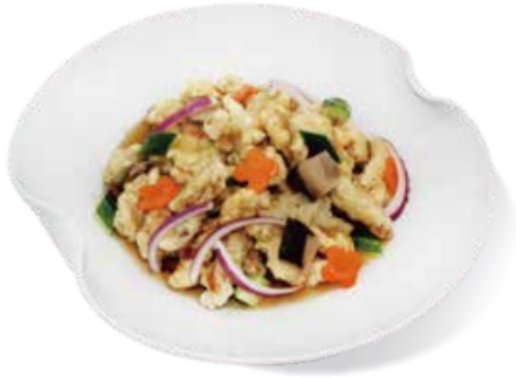
관동식 탕수육 돼지고기:국내산