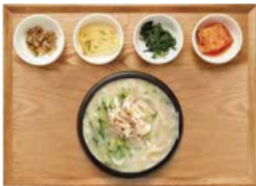
들깨 칼국수 ★ NEW