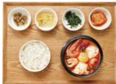
해물 순두부 꽃게:중국산