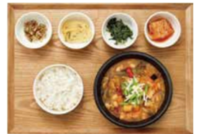
차돌박이 청국장 우차돌:미국산